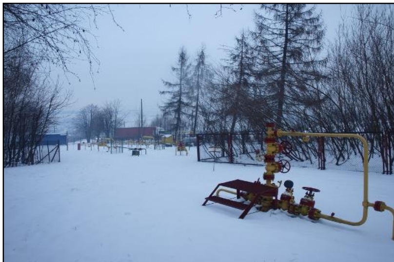
Ujęcie gazu w miejscowości Koźmice Małe