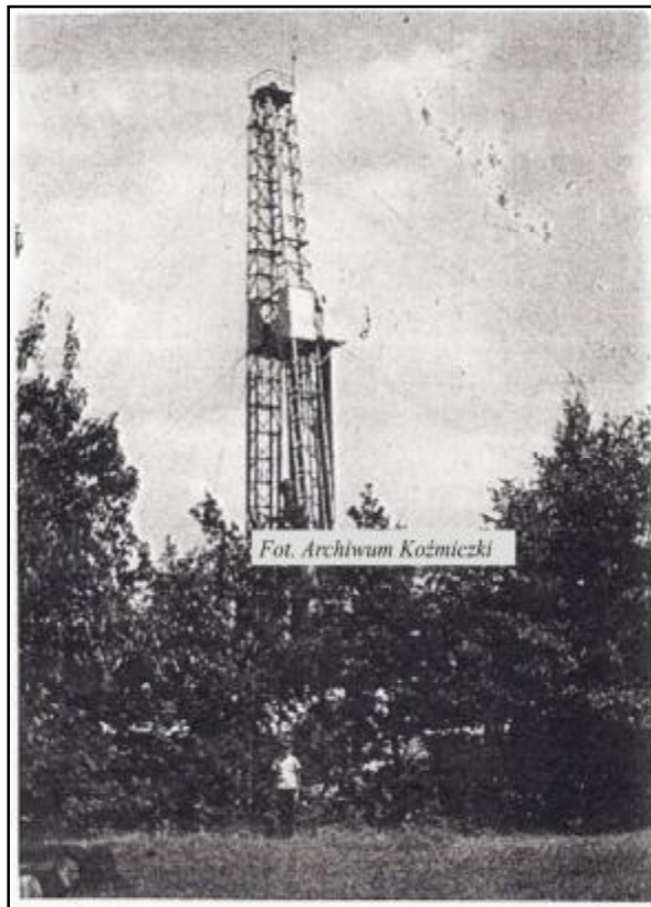
Wieża wiertnicza – Koźmiczki 1970 r.